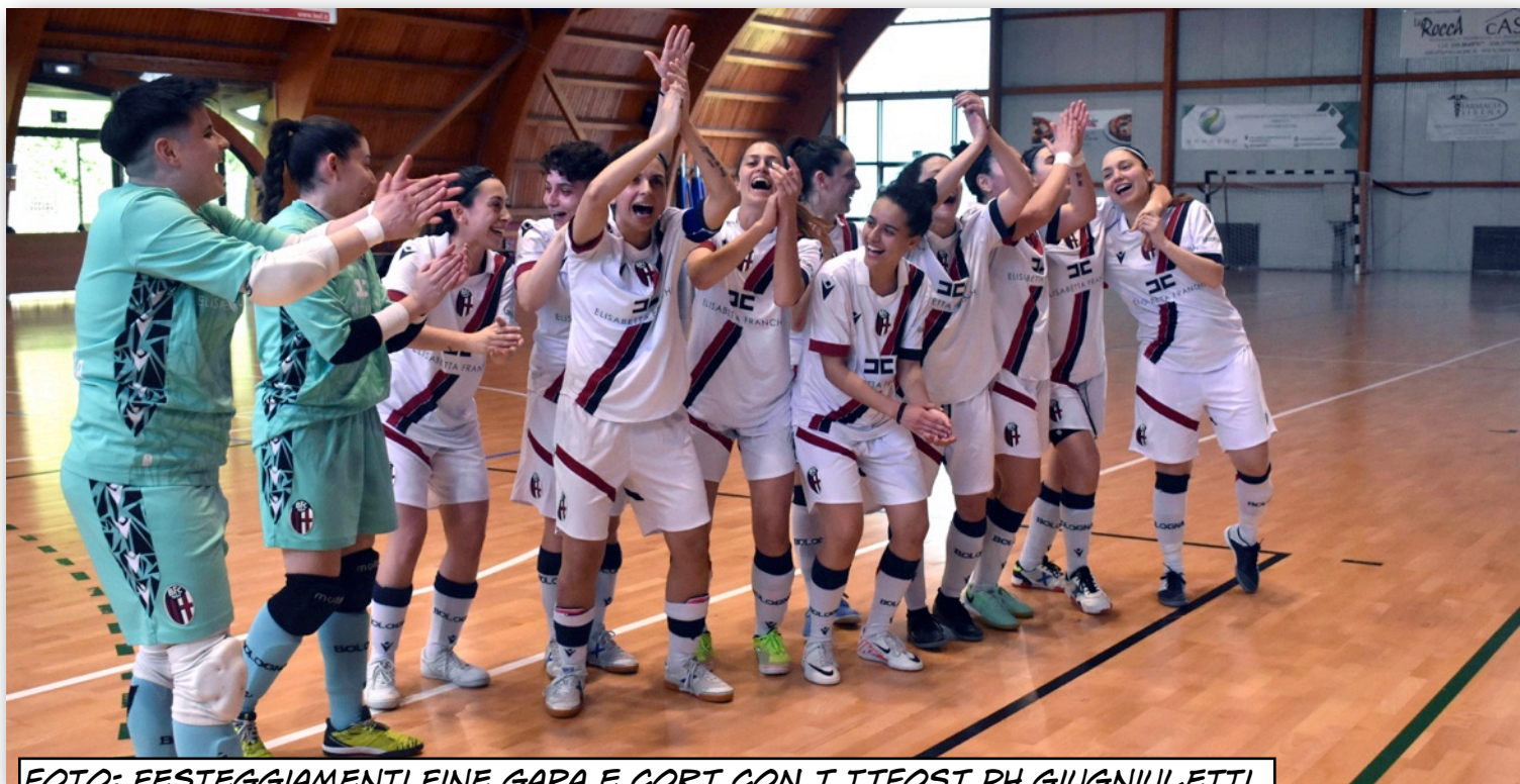
FOTO: FESTEGGIAMENTI FINE GARA E CORI CON I TIFOSI

Campionato Futsal Femminile Serie C - Girone Veneto BFC - Annia Serenissima 4-1 06/04/2024 h. 15:00 Palestra "Peppino Impastato" - Bazzano (BO)